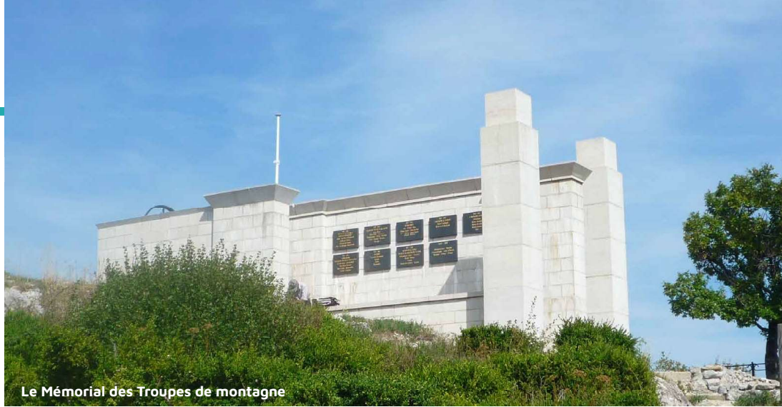
Le Mémorial des Troupes de montagne

« Saint-Martin-le-Vinoux est une ville aux mille facettes : géographiques, historiques, culturelles, patrimoniales... En la matière, la Seconde Guerre mondiale a durablement modelé la commune et son patrimoine : son passé résistant se dévoile dans le nom de ses rues, ses liens ténus avec les Troupes de montagne se retrouvent au mont Jalla et au fort de la Bastille. Soyons-en fiers ! »