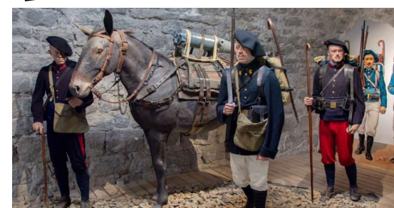
Exposition permanente au Musée des Troupes de montagne