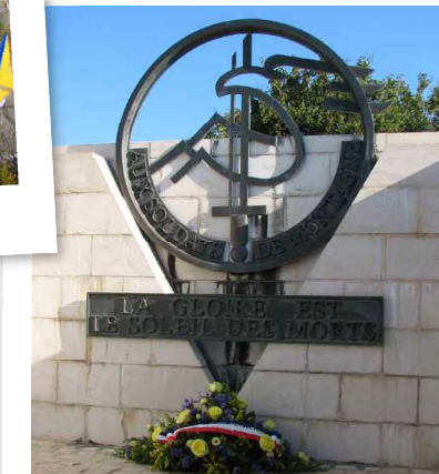
L'insigne de l'Union des Troupes de Montagne à l'intérieur du Mémorial