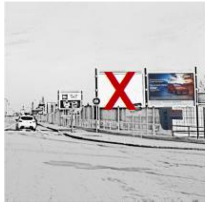
Figure 2. Exemple d'un support unique pour deux dispositifs scellés au sol.