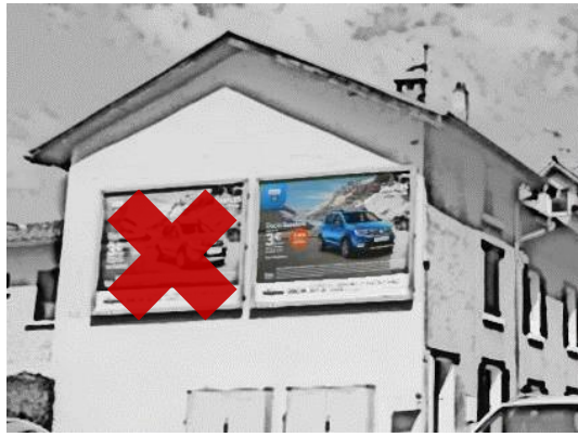
Figure 1. Un mur, ici considéré comme support, accueille deux dispositifs.